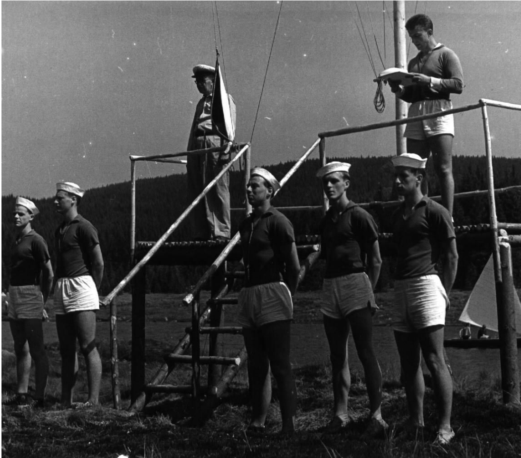
Boja jako přístavný na Souši 1957 mezi Ludvou a Strašidlem