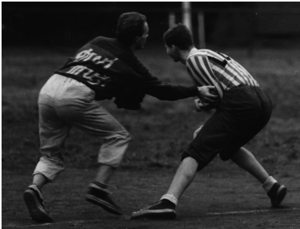
Boja (Diví muži) a Kotě (LEFI)