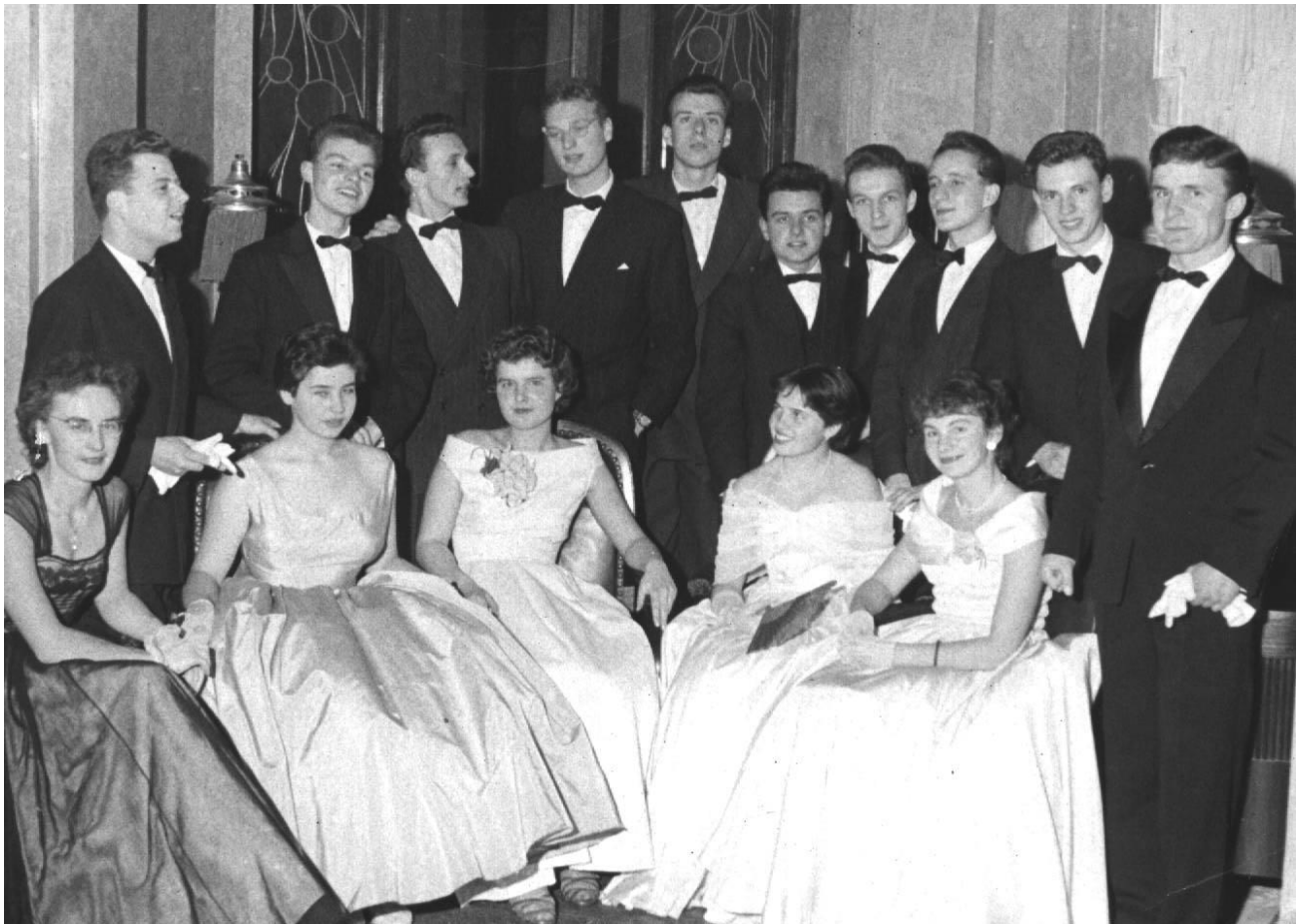
Boja na plese čtvrtý zprava