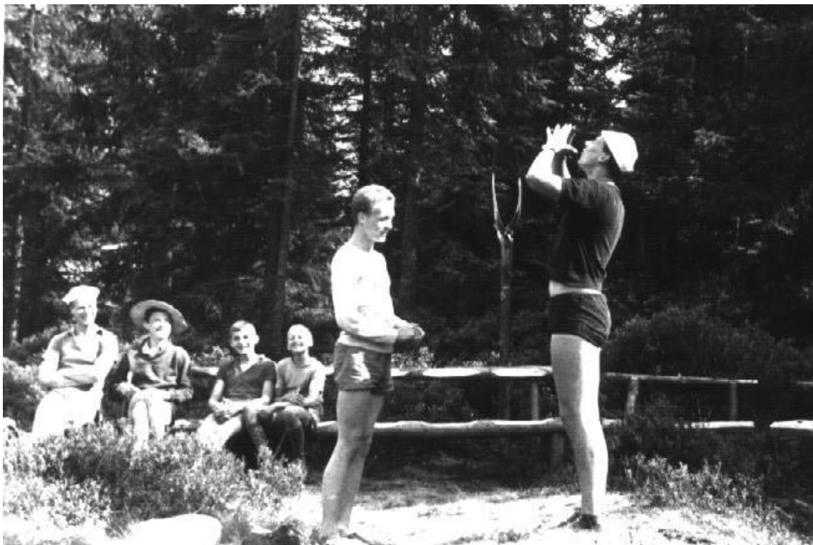
Boja s Ludvou nacvičují výstup k táboráku