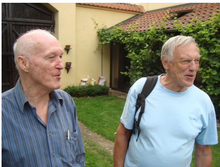
Boja s Kušníčkou na chůzce u Selima